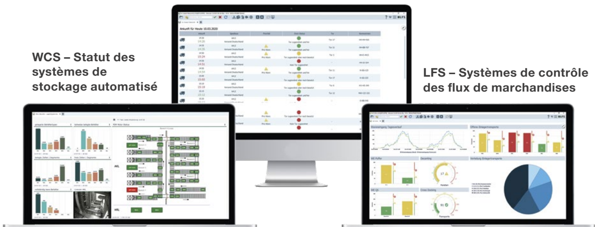
LFS – Systèmes de contrôle des flux de marchandises